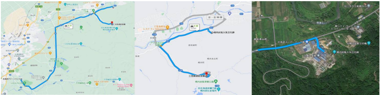
北海道グリーンランド～三笠 鉄道記念館～入気立坑 入気立坑跡 ((株) 北興工業)