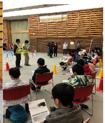
2月25日ドローン体験会デモ飛行と基礎知識 江別市公民館