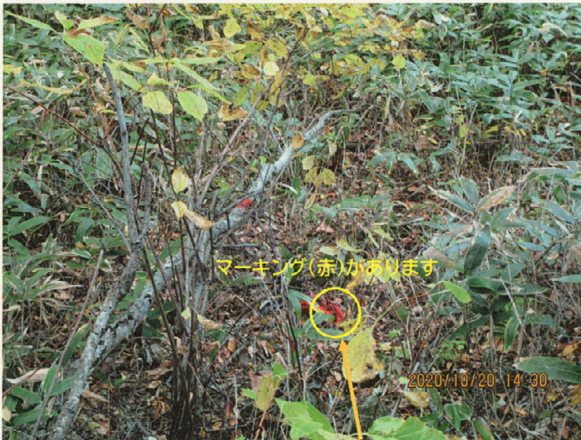
常盤真駒内線（北～南方向を撮影）⑤ R側その3